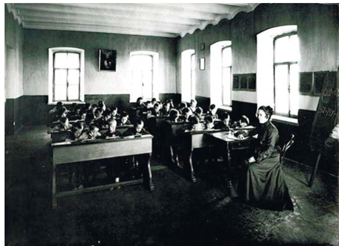
Урок в церковно-приходской школе Кокшеньги.

Так 1 октября 1919 года в селе Тарногский Городок 12 мальчиков и девочек местных крестьян сели за деревянные столы в нанятом у частного хозяина доме по улице Советской