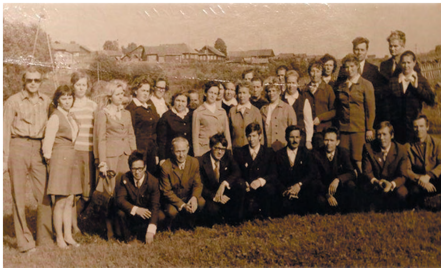
Коллектив Рослятинской школы 1976-1977 год.