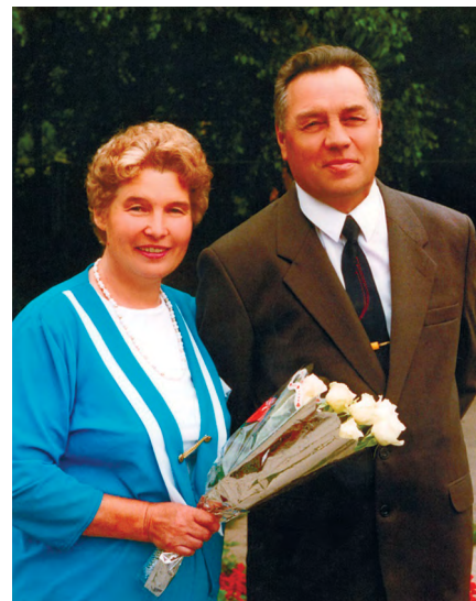
Мои бабушка и дедушка.

руководила большим пионерским загородным лагерем в деревне Середник. Дедушка работал директором профтехучилища №45 в Кадуе, а с 1987 года — учителем истории и военного дела в Кадуйской средней школе №1, затем — председателем Кадуйского поселкового совета, главой администрации.